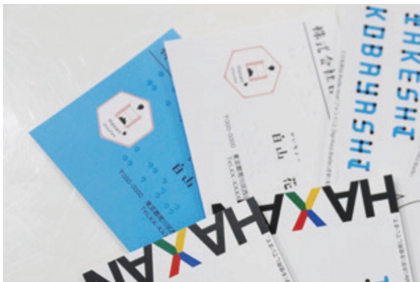
バリエーション豊富な点字名刺