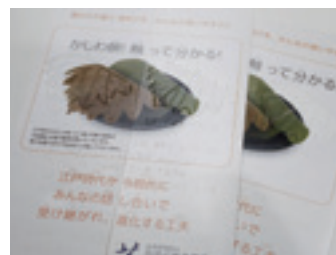
柏の葉の表裏が触って分かる かしわ餅冊子