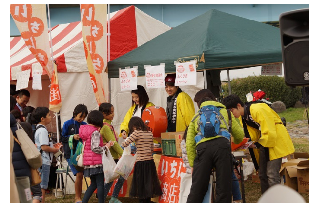
▲お仕事したら、イベント内紙幣「ガーヤン」がもらえ、「ガーヤン」と引き換えに福引ができます