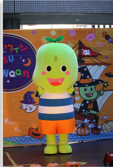
▲マスコットキャラクターの「まがりまめ君」