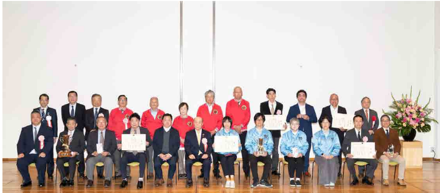
▲受賞商店街のみなさんと坂本産業労働局長(後列左)と市川審査委員長(後列右)