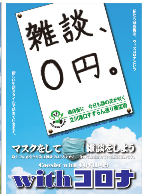
▲感染防止対策応援事業第3弾：啓蒙ポスター