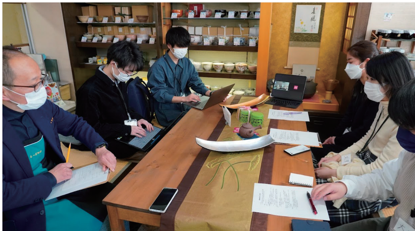
▲ 学生の新商品提案