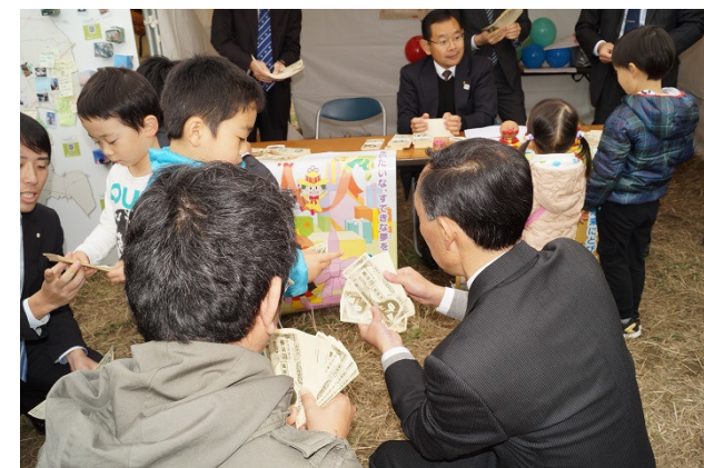
▲いちにち信用金庫 お札を広げて数えるトレーニングを