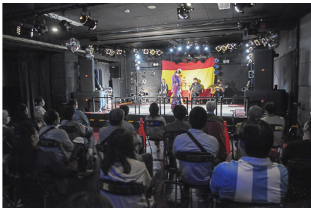
▲フラメンコライブステージ「ライブハウスBABEL」