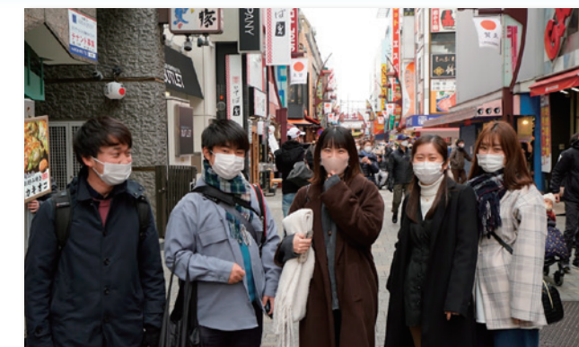
▲ 学生の商店街探訪・取材