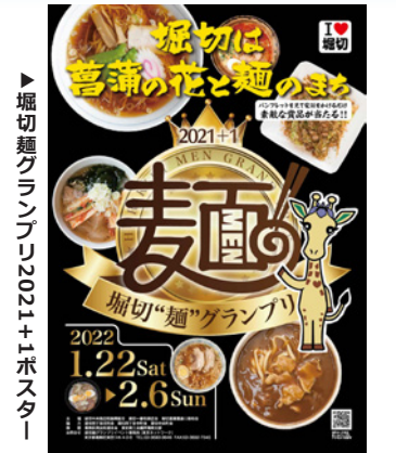
▲堀切麺グランプリ2021+1ポスター

新型コロナウイルス感染症防止対策を施しながら、無事に開催することができた。予想よりも多くの方に来訪していただいた。新型コロナウイルス感染症拡大で、自宅での自粛期間が長かったことから、イベントへの関心が高まったと考えられる。また、イベント実施時に消費者から、「コロナ禍でもイベントを楽しむことができた」と生の声を聞くことができた。