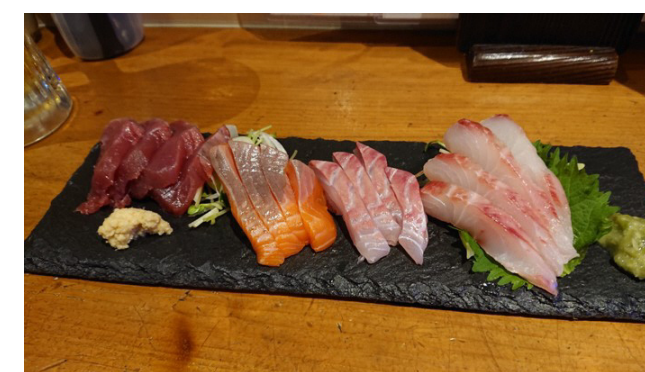
▲お刺身盛り合わせ (まちバル)