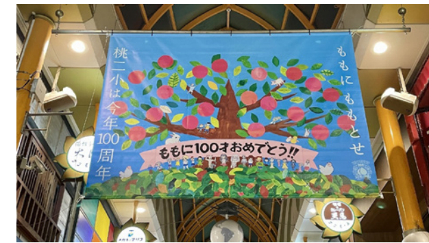
▲開校100周年記念展示