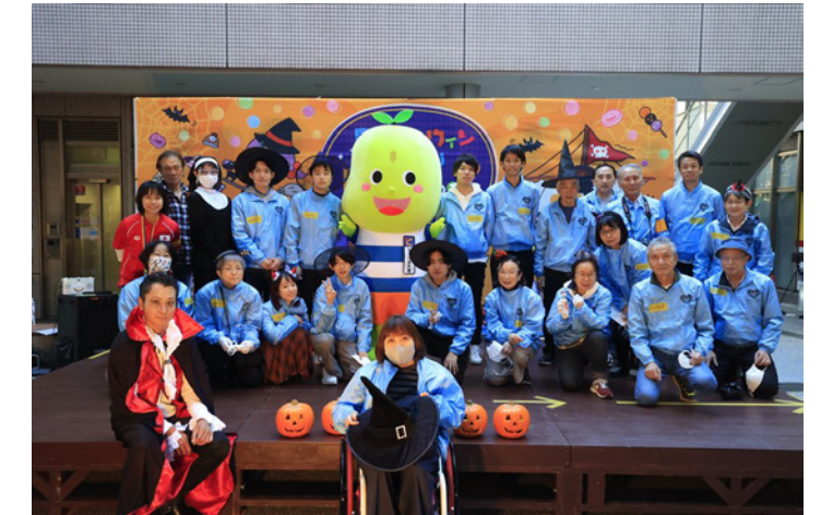
▲地域の皆さんと力を合わせて頑張りました！