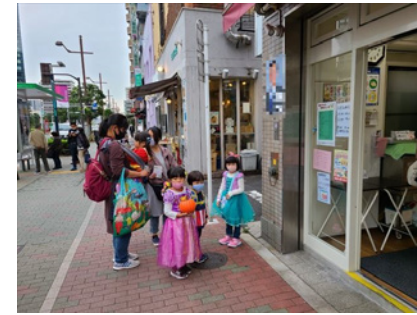
▲お菓子もらいウォークラリー

非常に多くの応募があり、子どもに加え親にも商店街に足を運んでもらう機会を生んだだけでなく、応募場所を店頭に限定したため、応募のついでに買い物や食事をするなど、店側にも経済効果があった。ウォークラリー形式にしたことで、商店街の回遊性も高められ、商店街のみならず地域全体が明るくなり、地域の活性化につながった。