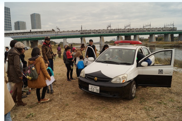
▲いちにち警察署 防犯のアナウンスをパトカーのマイクからします

参加者である子どもたちは、実際のお仕事体験を通じて、「まち」にいるおとなに直接触れることで、商店街の人々と顔見知りになることができた。また、回を重ねるごとに来場者が増え、商店街が公共的な役割も担っていることを地域住民に知らせてもらい、商店街の活性化にも繋がっていると感じる。