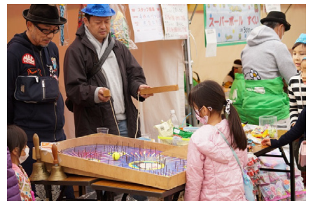
▲それぞれの商店街から、人気のゲーム、出し物も