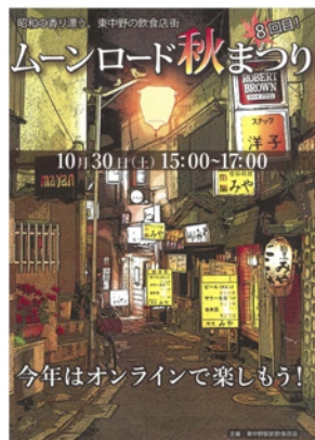
▶ムーンロード秋まつりチラシ

新型コロナウイルス感染症の影響で2年ぶりの開催となったが、リピーターが多く見受けられ、イベントが地域に定着してきていると感じた。また、オンライン視聴者からも応援の言葉だけでなく、「コロナが落ち着いたら、是非商店会に伺いたい」などの嬉しい声もいただき、リピーターのみならず新たな来街者の呼び寄せに期待ができた。