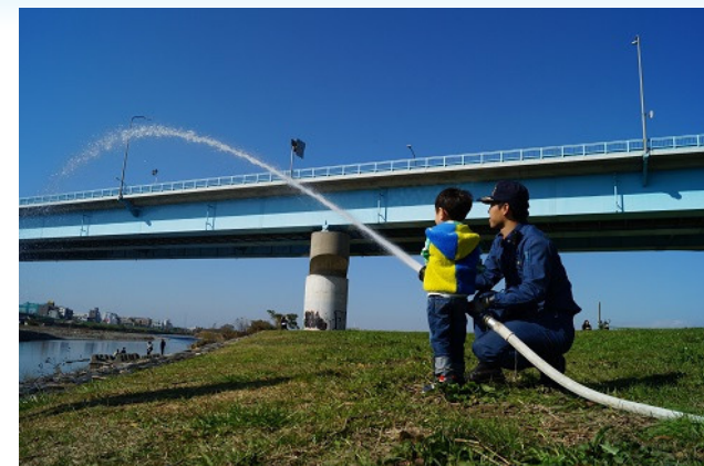
▲いちにち消防署 放水開始!