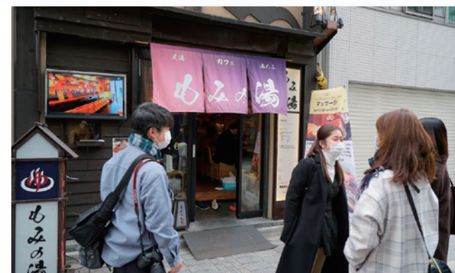
▲ 学生の店舗訪問・体験取材

また、各店舗での取材時に、学生から新しいアイデアが数多く生まれ、若い世代の率直な意見を各店主が聞くこともできたことで、個店のさらなる魅力向上に繋がるきっかけを作ることができた。