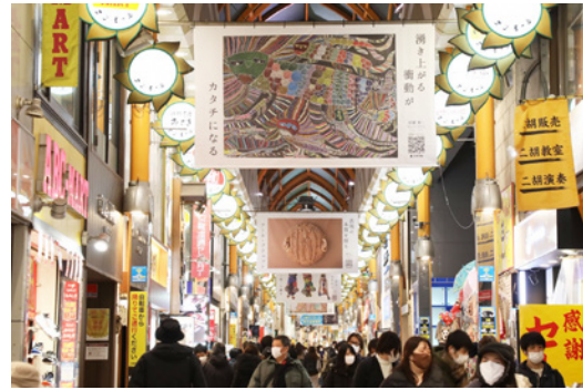
▲アール・ブリュット(1月～)