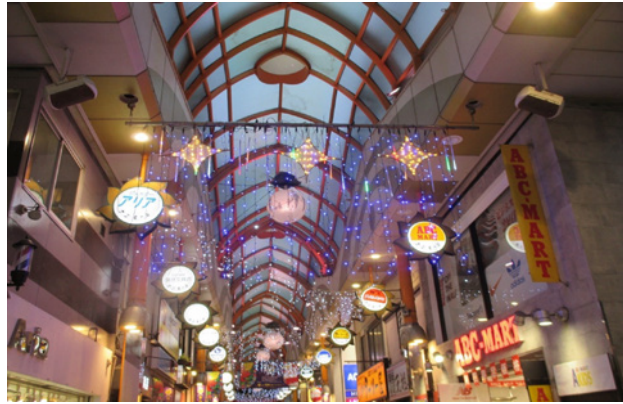
▲クリスマス装飾(12月～)