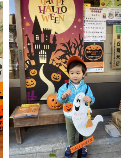
▲フォトスポットでおばけと一緒にパチリ