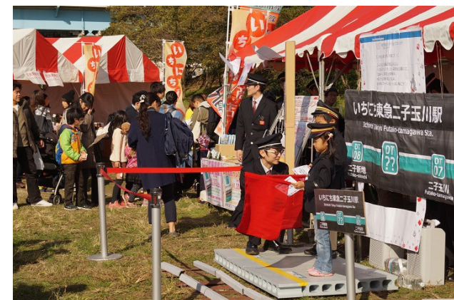
▲いちにち二子玉川駅 制服もセットも本格的で何度もお仕事したい子がたくさん