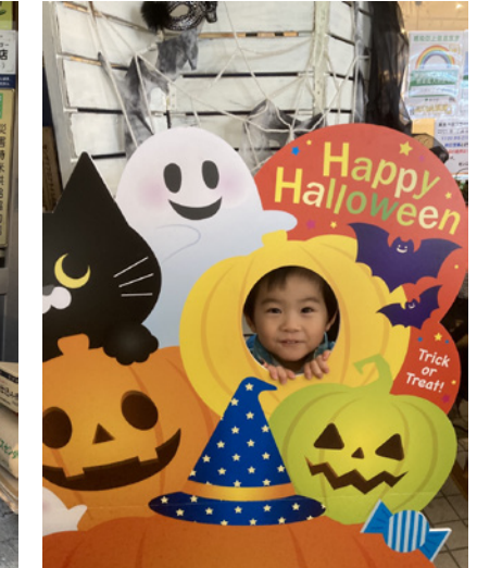
▲フォトスポットでかぼちゃになってパチリ