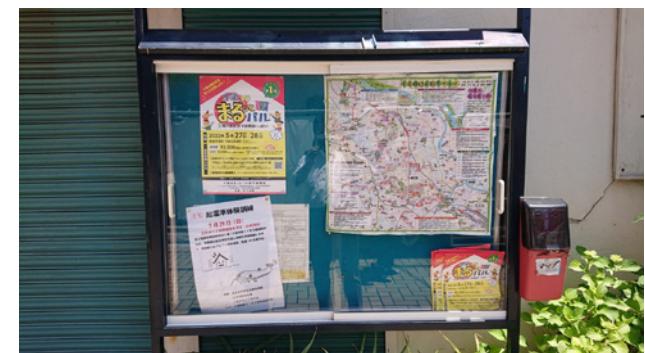
▲町会による告知協力 (掲示板)