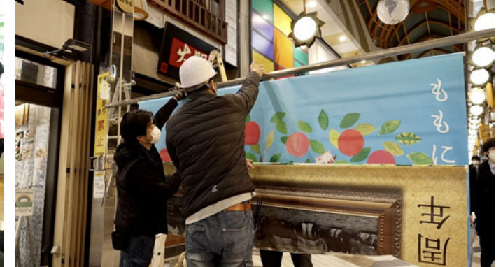
▲展示物掲示作業中