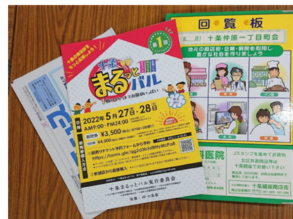
▲町会による告知協力 (回覧板)