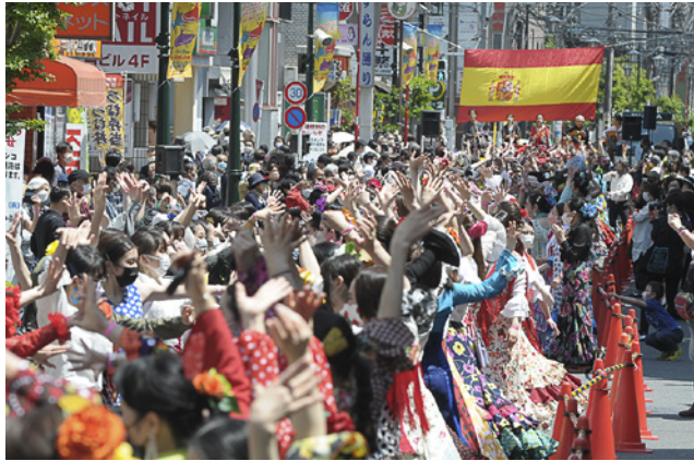
▲ストリートフラメンコ「セビジャーナス」