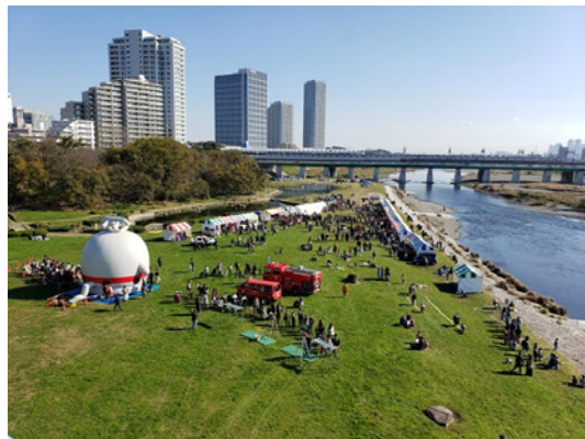
▲とにかく広い公園ですが、今日は「いちにち商店街」、夕方まで、「まち」になります