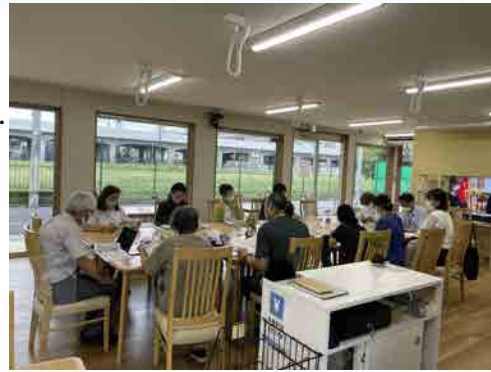
▲みんな愛ネットのミーティング風景

医療施設や幼・保育園、福祉施設等、多様な事業所が新たに会員となり、互いに顔が見える関係を構築することで地域での声掛けや挨拶等が格段に増え、住民にとって居心地の良い地域に発展し、商店会の域にとどまらず地域全体が活気づいている。みんな愛ネットでの取り組みを通して、商店会は街へ貢献するインフラであることを地域に訴求した。