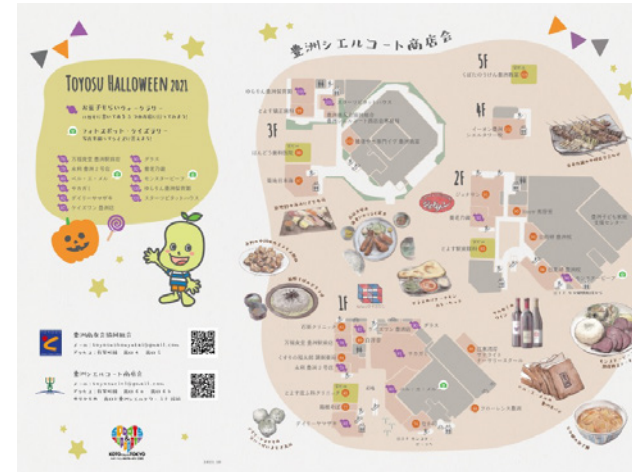
▲豊洲ハロウィンマップ