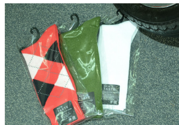
▲ソックス3点セット (みやバル)