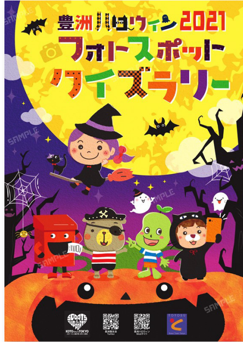
▲心がはずむ、かわいいポスター