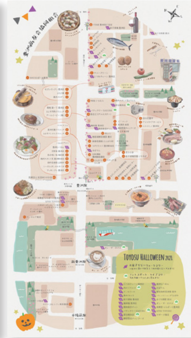
▲豊洲ハロウィンマップ