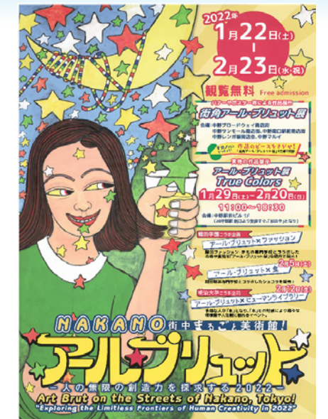
▲アール・ブリュットちらし