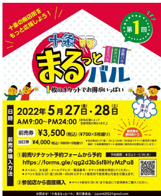
十条まるっとバル実行委員会

(十条銀座商店街振興組合、十条中央商店街振興組合、十条仲通り商店会、 十条富士見銀座商店街振興組合、いちよう通り十条駅西口商店会)