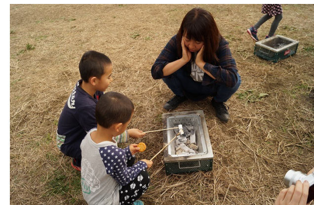
▲マシュマロ焼きの体験は、イベント内紙幣「ガーヤン」でしか交換できません