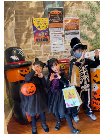
▲フォトスポットで決めのポーズ