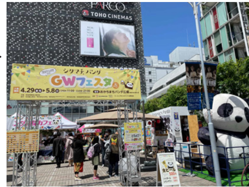
▲広場の入口では巨大パンダがお出迎え

たくさんの来街者が訪れ、家族の楽しいひと時を過ごしている光景がいたるところで見受けられた。地元の人気者のパンダのイベントは、双子パンダ誕生以降初めてだったこともあり大人気であった。こどもの日に実施したキッズフリーマーケットでは、子供たちがモノを大切にすることを、楽しく学ぶことができた。