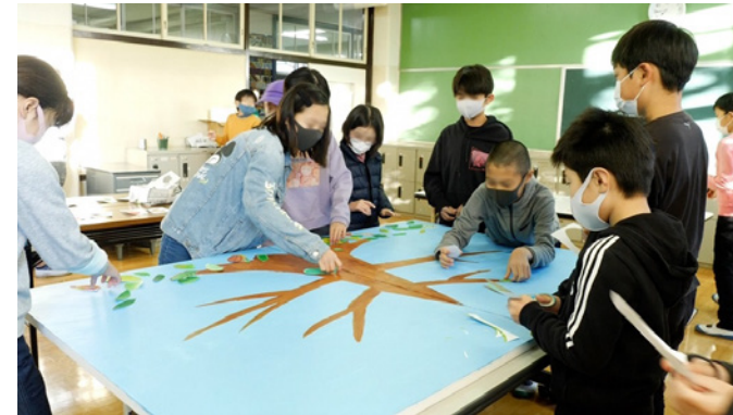
▲展示物を制作する学生たち