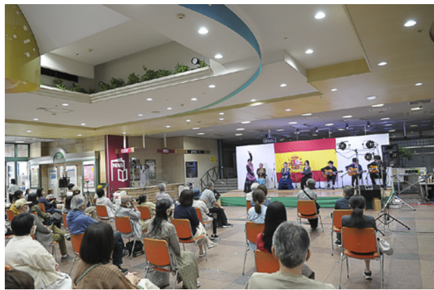
▲フラメンコライブステージ「JRAウイズ立川A館」