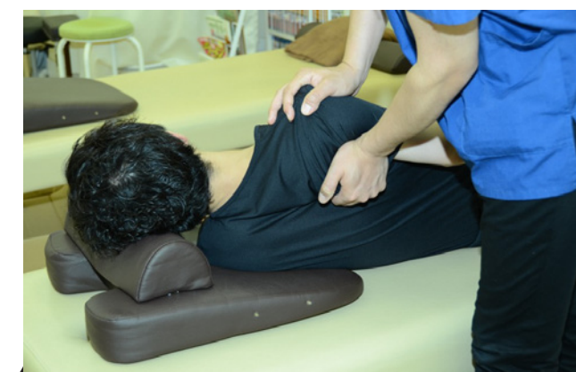
▲肩甲骨がし体験 (体験バル)