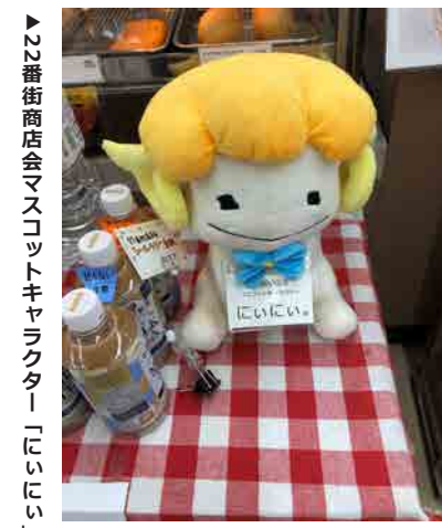
▲22番街商店会マスコットキャラクター「にいにい」

シールを集めるために大勢のお客様に商店街を歩いていただくことができ、入店したことのない新たなお店を知っていただくだけでなく、新規の顧客獲得につながりました。また、お客様の参加数も多く、予想を超える来客数と応募数があり会員と地域住民の距離が縮まり人と人のつながりを生むことができました。