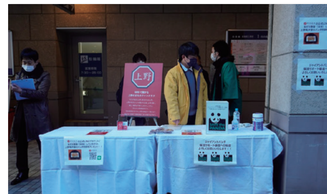
▲ 上野倶楽部開設の路上PR