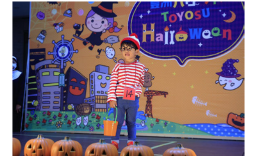
▲仮装コンテスト：みごと優秀賞に選ばれました！