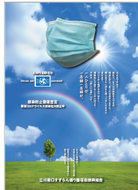
▲感染防止対策応援事業第2弾：啓蒙ポスター