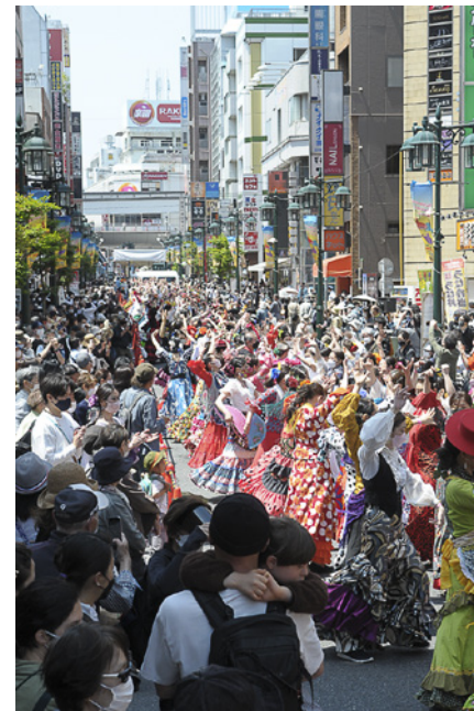
▲ストリートフラメンコ「セビジャーナス」