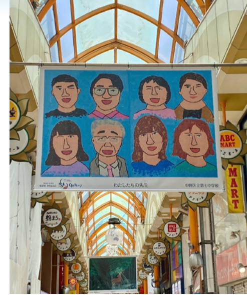
▲空中ギャラリー告知パネル