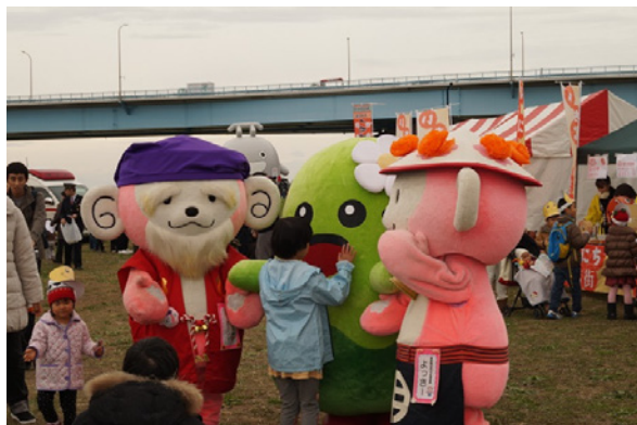
▲それぞれの商店街のキャラクターも集まります