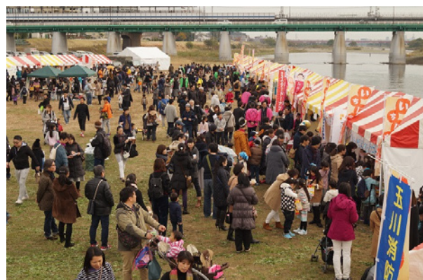
▲さあ、すいてるところは、どこだろう・・・