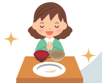
「食べきり」行動の啓発