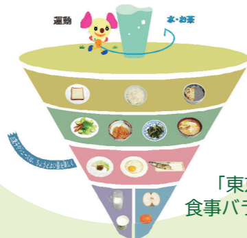
「東京都幼児向け 食事バランスガイドコマ」