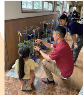
農家による 出前授業の様子