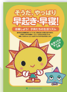
子どもの生活習慣 確立プロジェクト