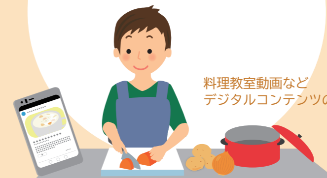
料理教室動画など デジタルコンテンツの活用