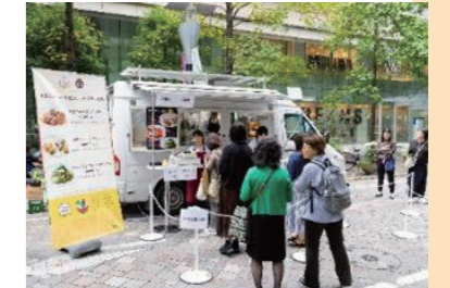
イベントを通じた 生産者との交流