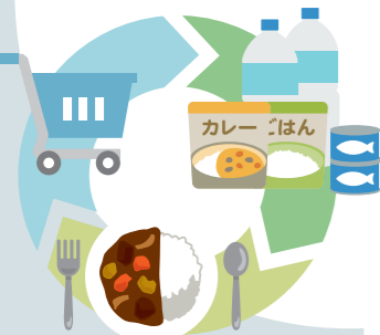
災害時を見据えたローリングストック法