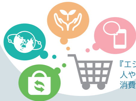
『エシカル消費』人や社会、環境に配慮した消費行動の推進