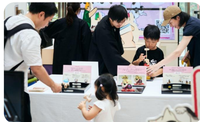
江戸文化等の展示・体験イベント (どこでもえどはく)

子供や若者、ファミリー向けに江戸文化に接するきっかけを作っていくとともに、デジタルコンテンツの活用等により、文化財への子供の興味・関心を喚起