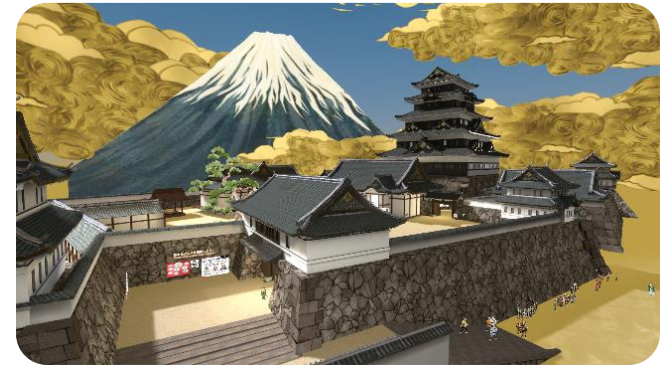
Virtual Edo-Tokyo Edo Area

→ 江戸の歴史・文化のPRを強化して世界の「EDO」として強力に印象づけ、江戸から続く伝統に関心を抱く旅行者の獲得を促進