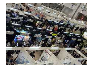
第3回たま未来・産業フェア