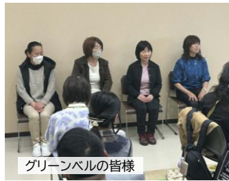
グリーンベルの皆様