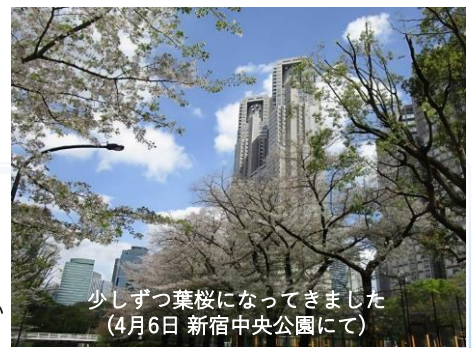
少しずつ葉桜になってきました (4月6日 新宿中央公園にて)