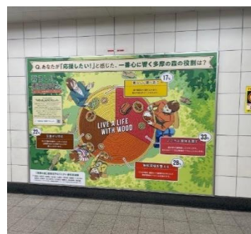
「"きになる"アイデア」丸太 (有楽町駅ロードプレミアム)