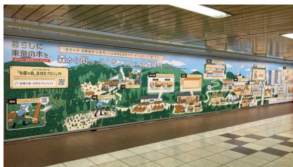
東京の木 多摩産材のスギ・ヒノキが使われた立体広告 (新宿駅メトロプロムナード)