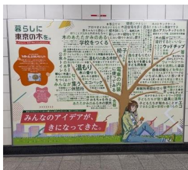
「"きになる"アイデア」きになる木 (有楽町駅ロードプレミアム)