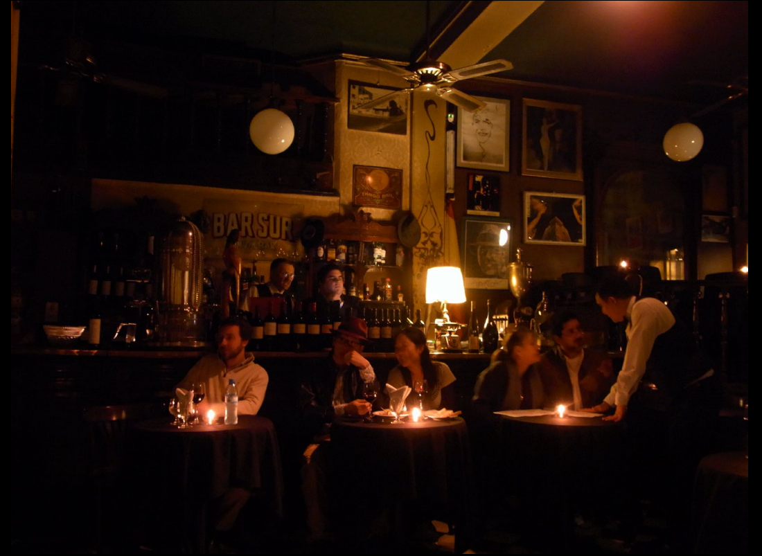
ブエノスアイレス、アルゼンチン