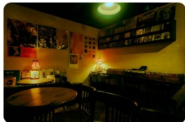
Cocktails & Cozy Corners