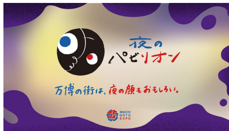
2025年: 夜のパビリオン プログラム