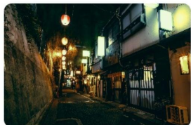
Casual Bars & Local Communities