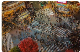
First Night in Shibuya

Shibuya nights shift fast—one turn is music, the next is cocktails, then a casual bite, then midnight. This guide helps you choose a starting point and hop around on foot. Keep it easy, read the room, and let the city set the pace.