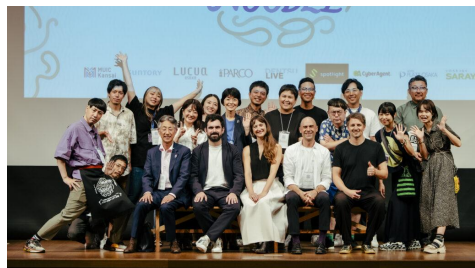
2025年: demo!play NOODLE (アフター万博アイデア会議)