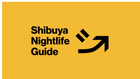
2025年: Shibuya Nightlife Guide (渋谷区夜間観光戦略)