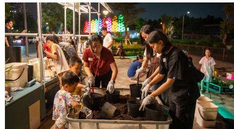
2025年: Night Park in ホーチミン