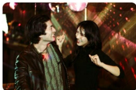
Midnight in Shibuya