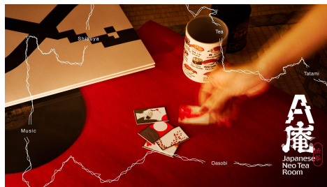
2026年: A庵 渋谷