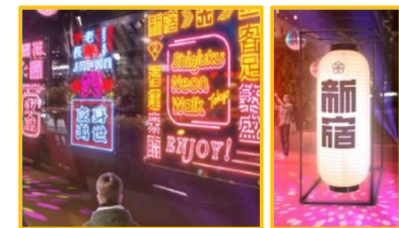
【ネオンアート・提灯】