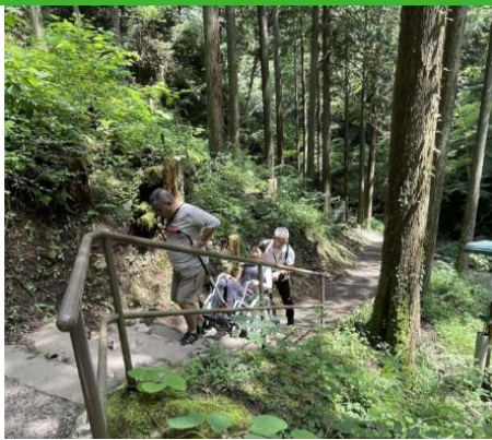
車いす牽引装置JINRIKIを活用したトレッキング