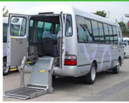
利用予定のリフト付き小型バス(イメージ)