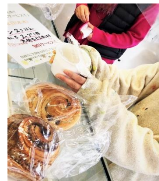
カフェ提供：テイクアウト