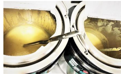
カフェ提供：さつまいもポタージュ