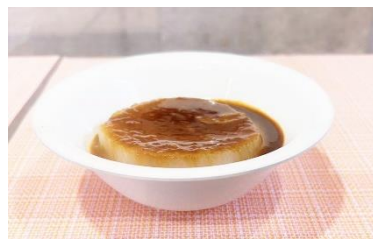
食堂提供：しろふき大根