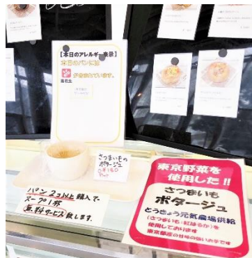
カフェ提供：イートイン