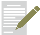
手書きの売上帳 のコピー