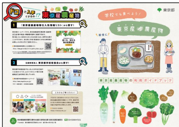
東京産農産物の利用ガイドブック

https://www.sangyo-rodo.metro.tokyo.lg.jp/nourin/shoku/promoter_shien