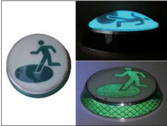
ドーム型 蓄光式3Dピクトマーカー