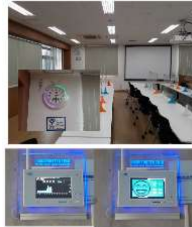
オフィス内、作業スペース内にスマートメーター、スマートクロックを設置し、電気使用量、ピーク時の見える化、節電意識向上、削減効果を共有。