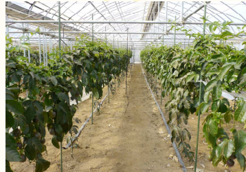
きれいに整備されたハウス内