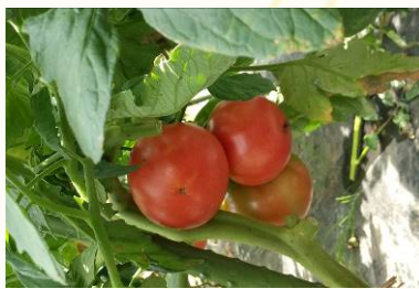
こだわりの土で育ったトマト