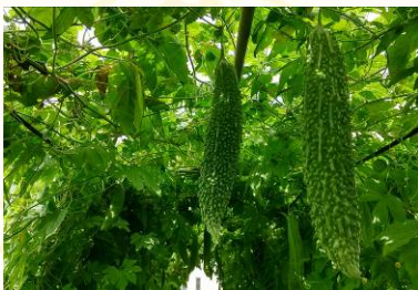
みずみずしいニガウリ