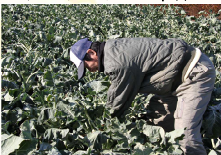
ブロッコリーの収穫