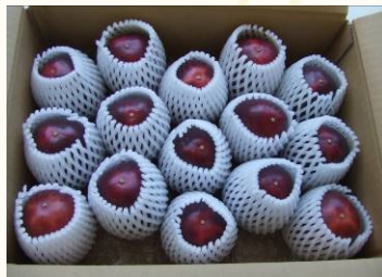
丁寧に箱詰めされて出荷