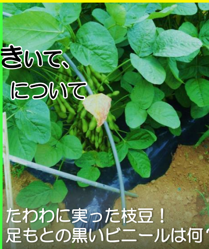
たわわに実った枝豆！ 足もとの黒いビニールは何？

エコ農産物の説明や、 農家さんのお話をきいて、 「環境にやさしい農業」について 考えてみましょう！