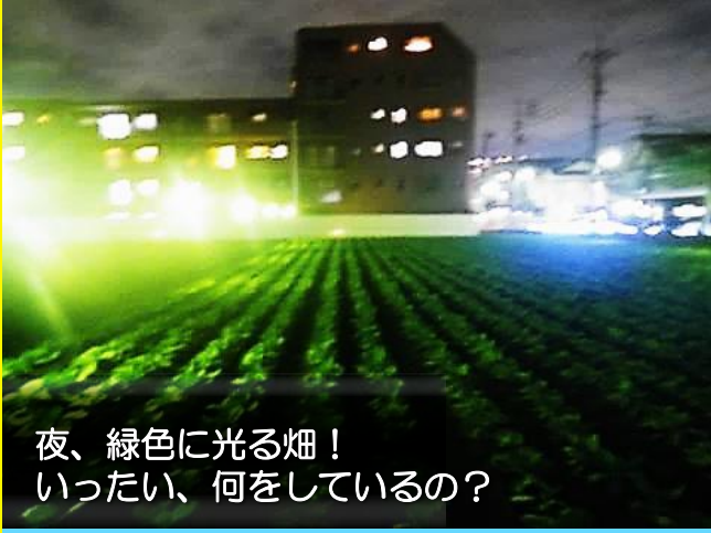
夜、緑色に光る畑！ いったい、何をしているの？

練馬の農家さんの畑で、 農薬や化学肥料を減らした 「環境にやさしい農業」を 見てみましょう！