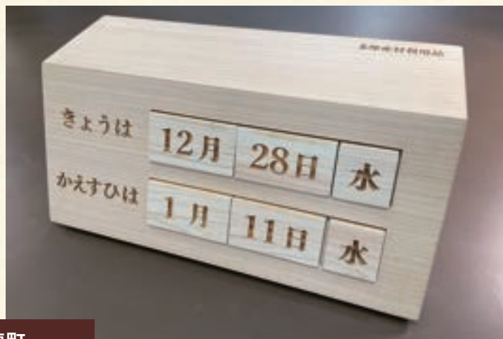
瑞穂町 図書館 サイン