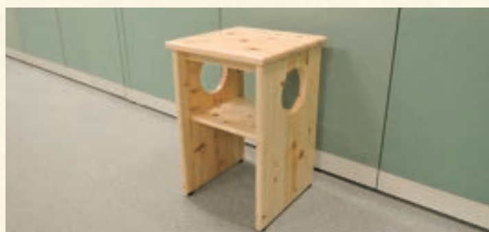
受付カウンター手荷物台