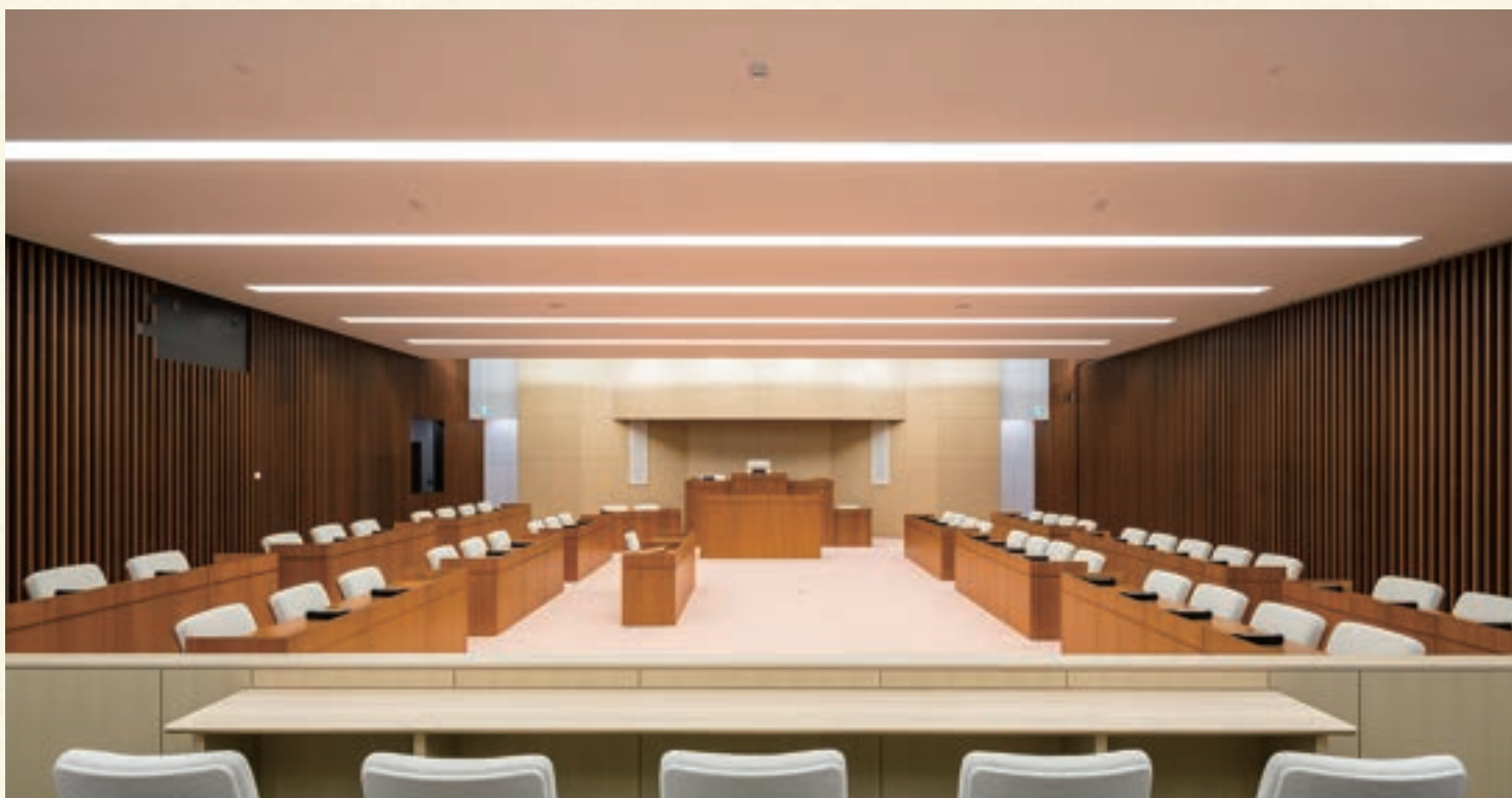
清瀬市 議場什器 (議長机、発言台、机、椅子)