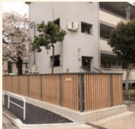
既存ブロック塀等から木柵への改修事例【都営住宅】