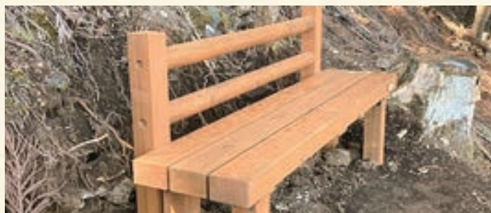
南郷地区 背付きベンチ