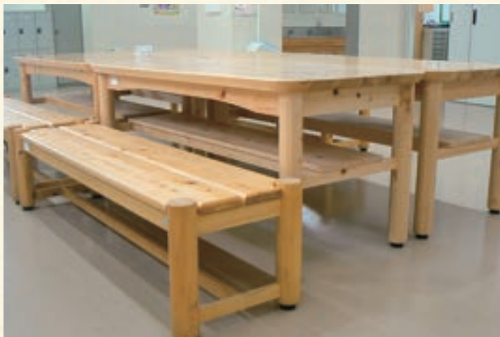
都立学校 テーブル・ベンチ