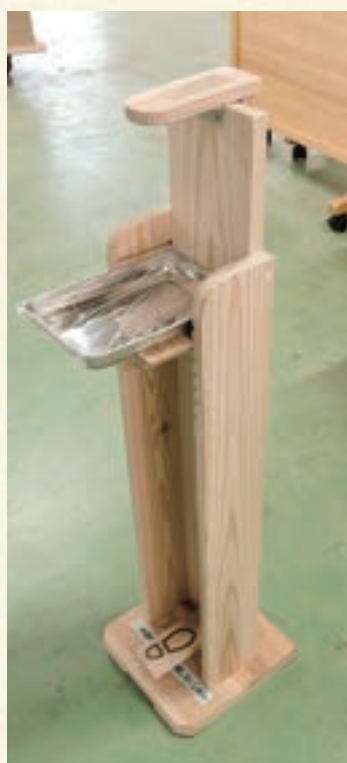
手指消毒用ボトルスタンド