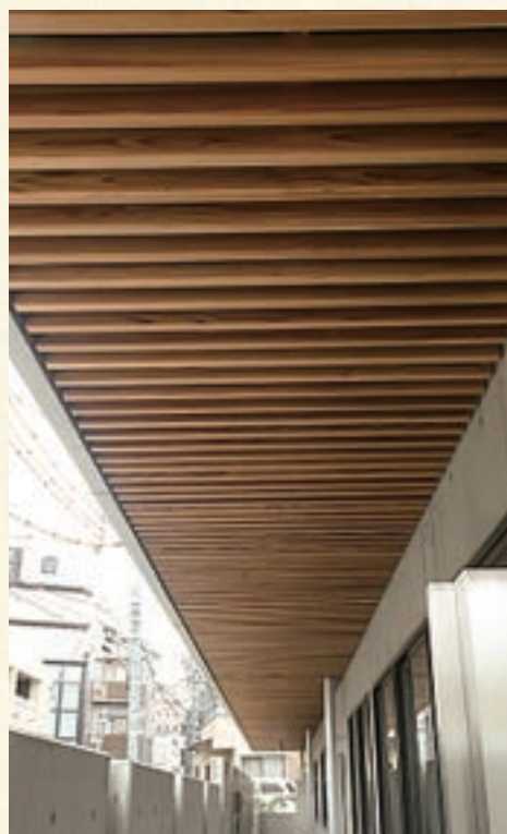
港区高輪台小学校軒天