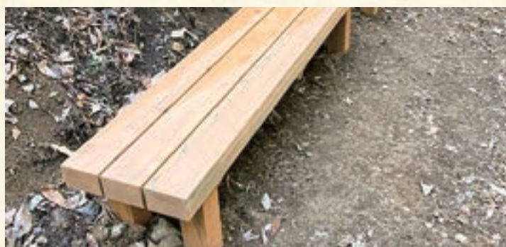
南郷地区 背無しベンチ