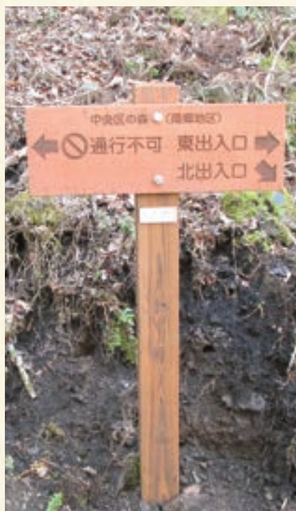
南郷地区 方向指示板