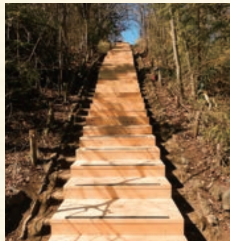
土木工事 明治の森高尾国定公園・稲荷山線歩道