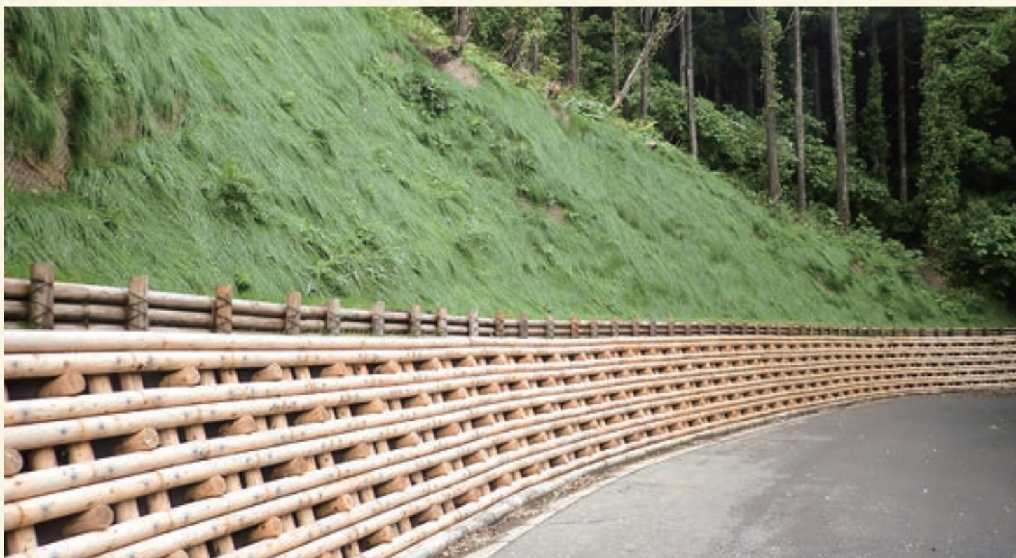
大島町間伏林道 木製ブロック積工、丸太筋工