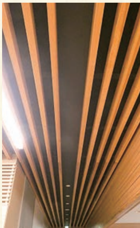
港区高輪台小学校 天井ルーバー