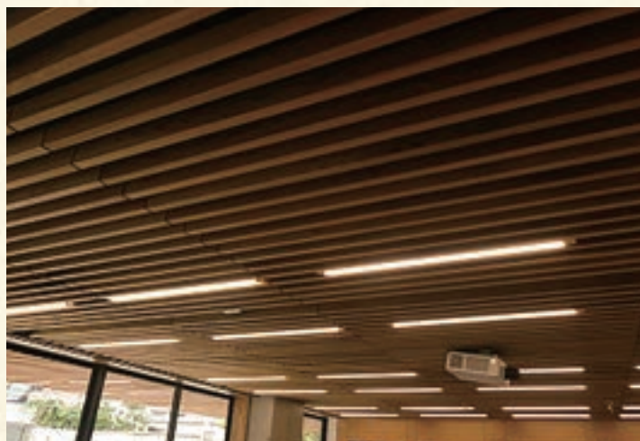
港区高輪台小学校天井ルーバー