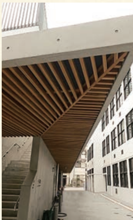
港区高輪台小学校軒天