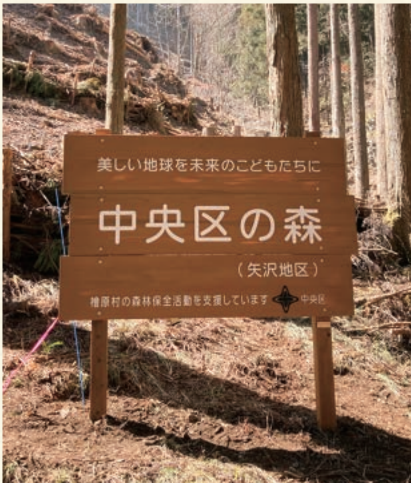
中央区の森 (矢沢地区) 看板