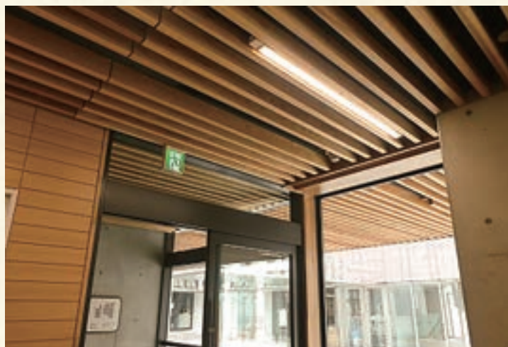
港区高輪台小学校天井ルーバー