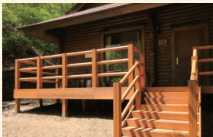
土木工事 山のふるさと村デッキ用材