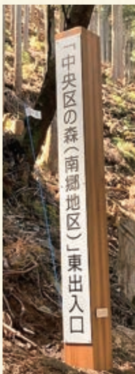
南郷地区 入口標識