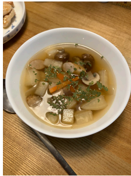
大根入りの野菜スープ