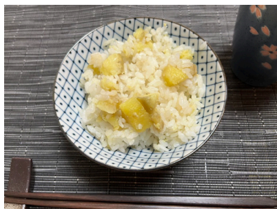
さつまいもごはん