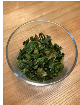
大根の葉のふりかけ