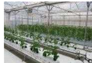
高収益農業の研修施設