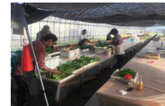
福祉農園（農福連携）