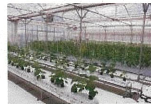
高収益型農業の研修施設