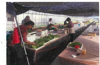
福祉農園（農福連携）