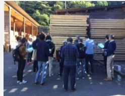
【製材所のイメージ】