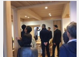
【多摩産材モデルハウスのイメージ】