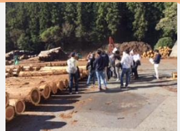
【多摩木材センターのイメージ】