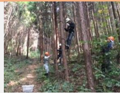
【森林体験のイメージ】