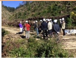
【伐採現場のイメージ】