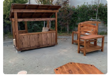
杉並の家さくら保育園/ 屋外遊具