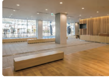
日野市立南平体育館エントランス/ 内装