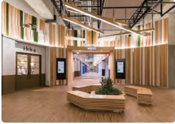
nonowa 東小金井 WEST/ 内装