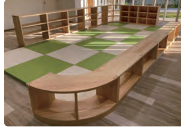
世田谷区立教育総合センター/ 什器