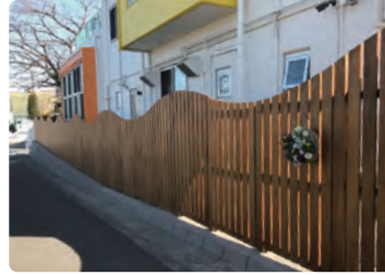
社会福祉法人町田南保育園/ 外構