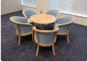
海の森水上競技場/ 什器