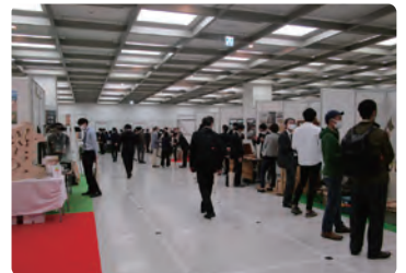
多摩産材利用拡大フェア 2021 の様子