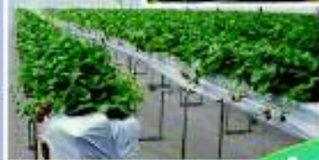
▲イテニ二施設整備