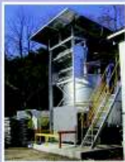
▲研修場兼利用施設