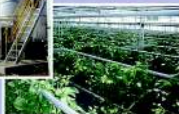
▲観光・交流農園の整備