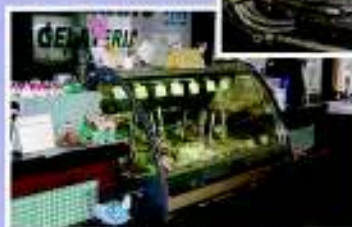
▲ジュース加工・精製施設