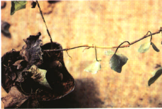
セイヨウキツタの罹病株。