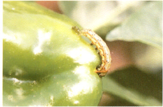
中齢幼虫（ピーマン）