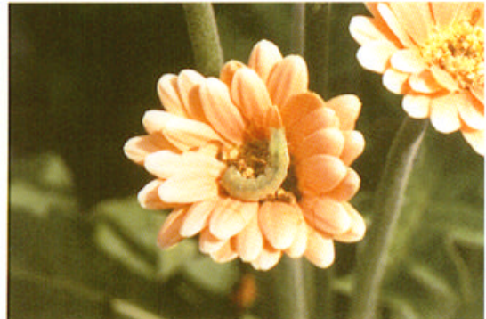
老齢幼虫（ミニガーベラ）