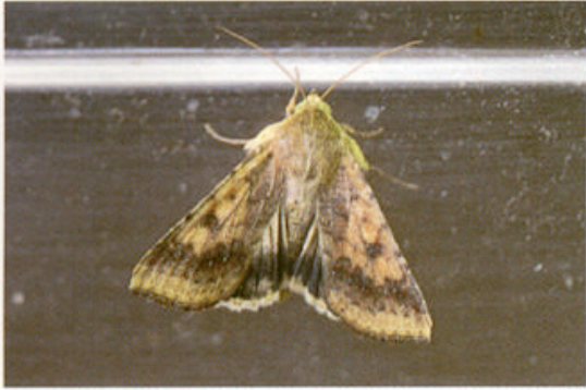
飼育による羽化成虫