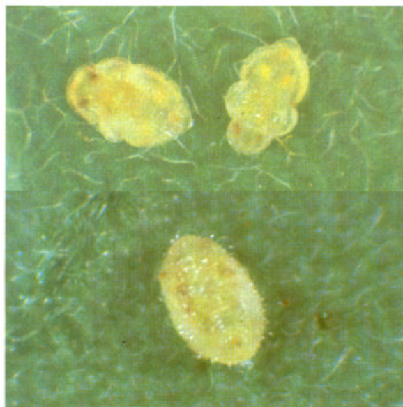
タバココナジラミ（上）オンシツコナジラミ（下）の幼虫