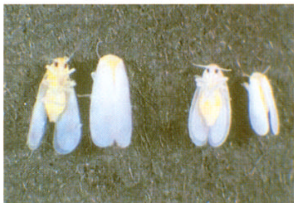
タバココナジラミ（右）とオンシツコナジラミ（左）の成虫