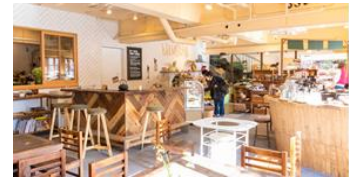
カフェ・レストラン