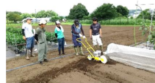
共同農園 (利用者が共同で耕作)