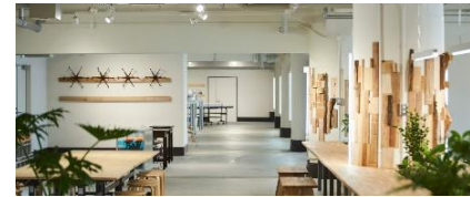
コミュニティスペース