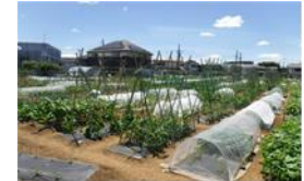
個人農園 (利用者に貸出し)