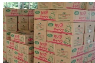
オリジナル出荷箱の製作