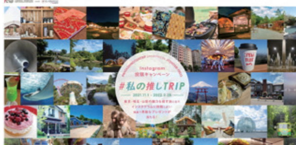
東京と近隣県の特設ウェブサイト

▶ 地元の魅力を再発見し、近場の観光を繰り返し楽しめるよう、東京周辺の観光ルートの特設ウェブサイトで紹介するとともに、実際の周遊を促す旅行者参加型キャンペーンを展開する。