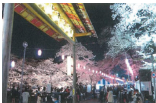
玉川上水 桜のライトアップ