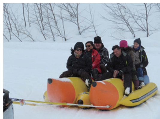
スノーアクティビティ(札幌市)