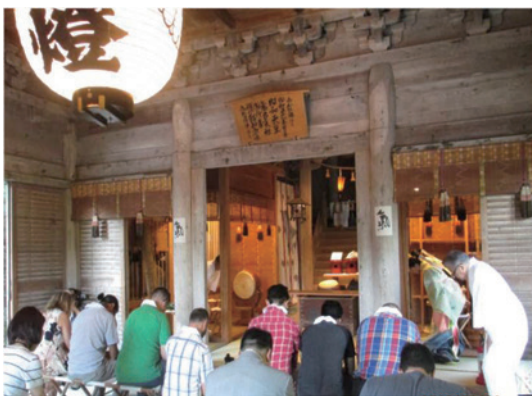
神社での祈祷体験(石川県)