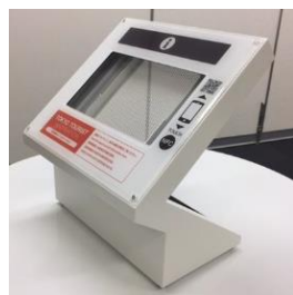
デジタルサイネージ (屋内卓上型)