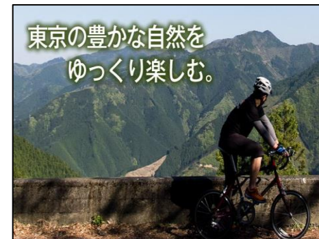
GPSTラッカー付自転車

【採択事例 ②】 「無人対応可能なGPS搭載自転車レンタルサービス」 ・奥多摩、青梅地区において、数か所で乗捨てができる、GPSTラッカーを搭載した電動アシスト付のレンタサイクルサービスを提供