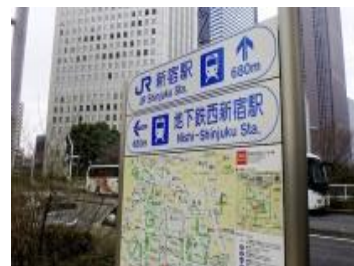
Wi-Fiスポット (観光案内標識)