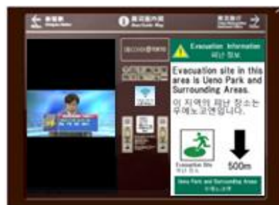
Lアラート発信時(イメージ) ○右面:Lアラート携帯画面を表示 ○左面:NHK放送を表示