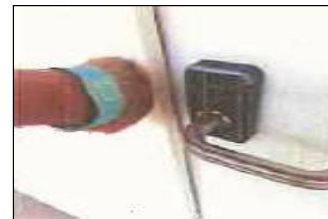
ICタグ付 リストバンド

【採択事例 ①】 「IoTを活用した、無人チェックインホテル基幹システムの開発」 ・宿泊客の予約情報に紐づいたICタグ付リストバンドによる入退室キー管理と料金の精算システムの開発