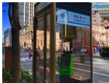
Wi-Fiスポット (公衆電話ボックス)