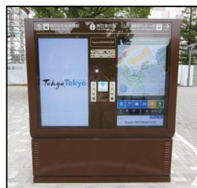
デジタルサイネージ(屋外)