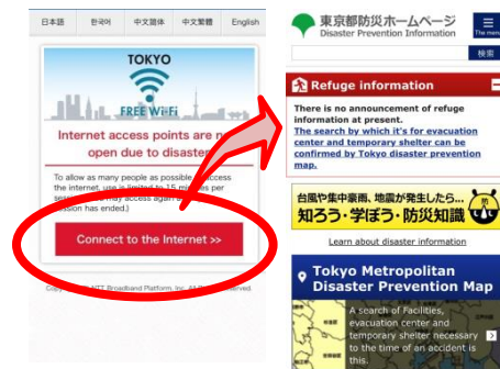
発災時のWi-Fi接続画面 (東京防災HPへの誘導)