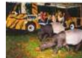
ナイトサファリ (シンガポール)