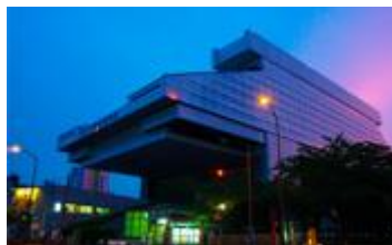
東京都江戸東京博物館

※ 写真美術館では木曜日でも21:00まで延長 「夜のミニコンサート」などを実施