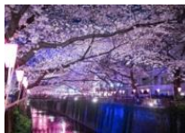
桜のライトアップ（目黒川）