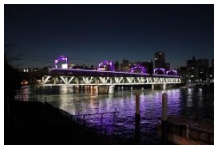
東武鉄道 隅田川橋梁