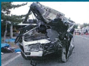
関越道高速 ツアーバス事故

重大な事故を起こした貸切バス会社はいずれも下限額を下回る運賃で運行を行っていました。