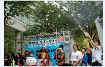
真夏の雪まつり(2018年8月)