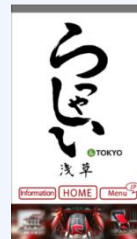
アプリ(らっしやい浅草)