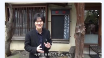
インフルエンサーによる動画配信