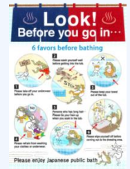
入浴方法案内リーフレット