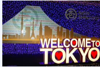
イルミネーション(2018年2月)